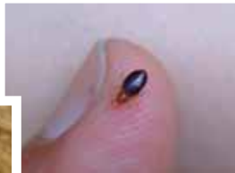
Comparasion de tamaño