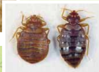
No Alimentado • Alimentado